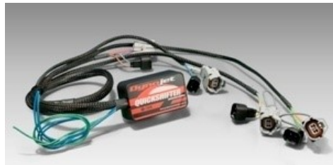
QEM 133,15 Quickshifter Expansion Module