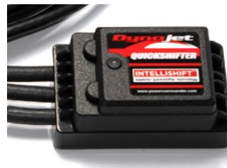
Ignition Quickshifter 4-126